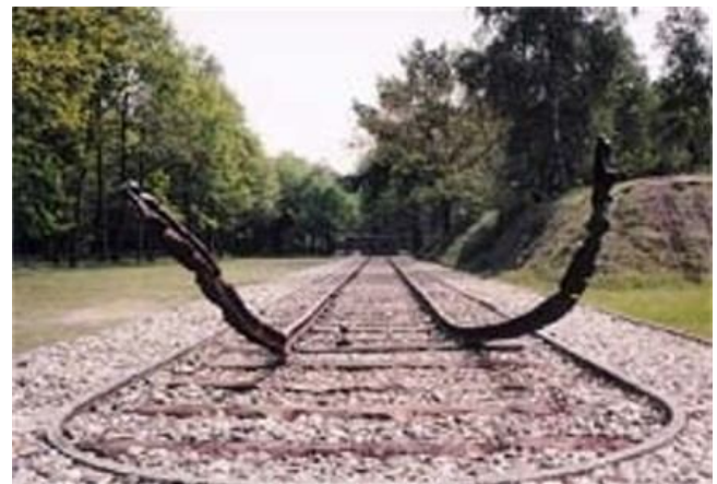
De spoorweg naar kamp Westerbork.

Dit was mijn werkstuk! Ik hoop dat hij interessant was ,,