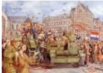
5 mei (tekening)