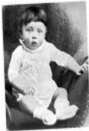
Dit is een baby foto van Hitler.

De mensen wisten vroeger nog niet wat voor een vreselijke dingen deze man zou doen.