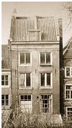
Gemaakt door Nick