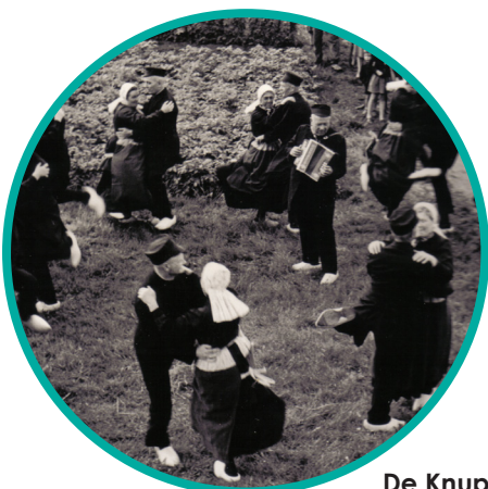
De Knupduukskes dansen De Driekusman